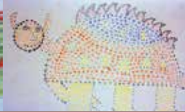
A. Atelier Les rites de passage à l'époque antique et contemporaine / B. Atelier Les codes vestimentaires et les parures corporelles C. Dessins de la Tarasque. Atelier Les traditions festives en Provence / D. & E. Atelier Les trésors du quotidien - MuCEM F. Atelier Les trésors des Marseillais / G. Blasons imaginaires. Atelier Les traditions festives en Provence / H. Atelier Les pèlerinages à Notre-Dame de la Garde et à la Mecque / I. Exposition des seniors au MuCEM. Atelier Les trésors du quotidien .